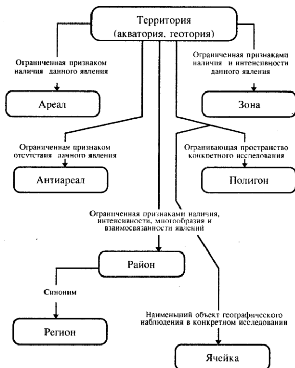
Рис. 32. Единицы пространства (по Э. Б. Алаеву)

Задание 32. Пользуясь схемой «Единицы пространства» (рис. 3.2), выясните и письменно запишите, что такое «ареал», «зона», «район», «регион» и как соотносятся эти понятия.